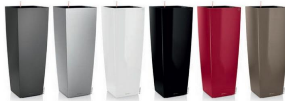
Slika 2. Primjer ukrasne posude