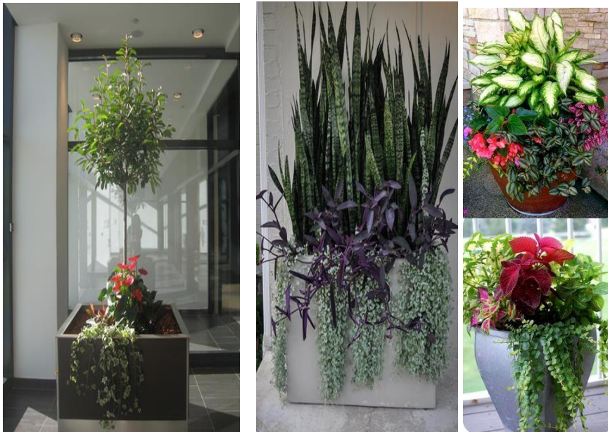
Slika 4. Primjeri cvjetne posude

Natjecatelji zajedno timski objašnjavaju i pokazuju svoj rad, bez obzira na način izlaganja, uvažavajući osobne mogućnosti natjecatelja te količinu podataka o radu, na standardnom hrvatskom jeziku.