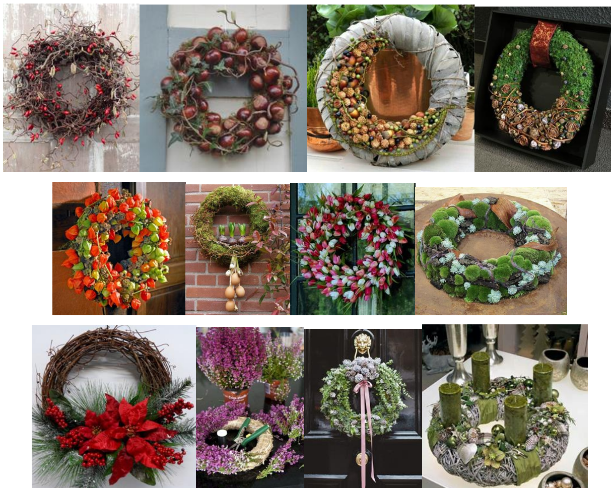
Slika 3. Primjeri vjenčića

Natjecatelji zajedno timski objašnjavaju i pokazuju svoj rad, bez obzira na način izlaganja, uvažavajući osobne mogućnosti natjecatelja te količinu podataka o radu, na standardnom hrvatskom jeziku.