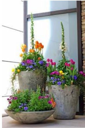
Slika 1. Primjer zasađene posude